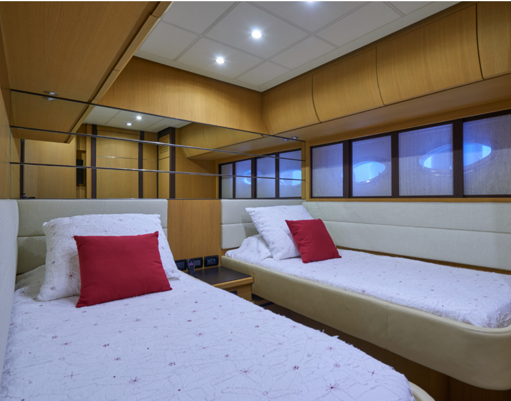
Camarote Twin babor