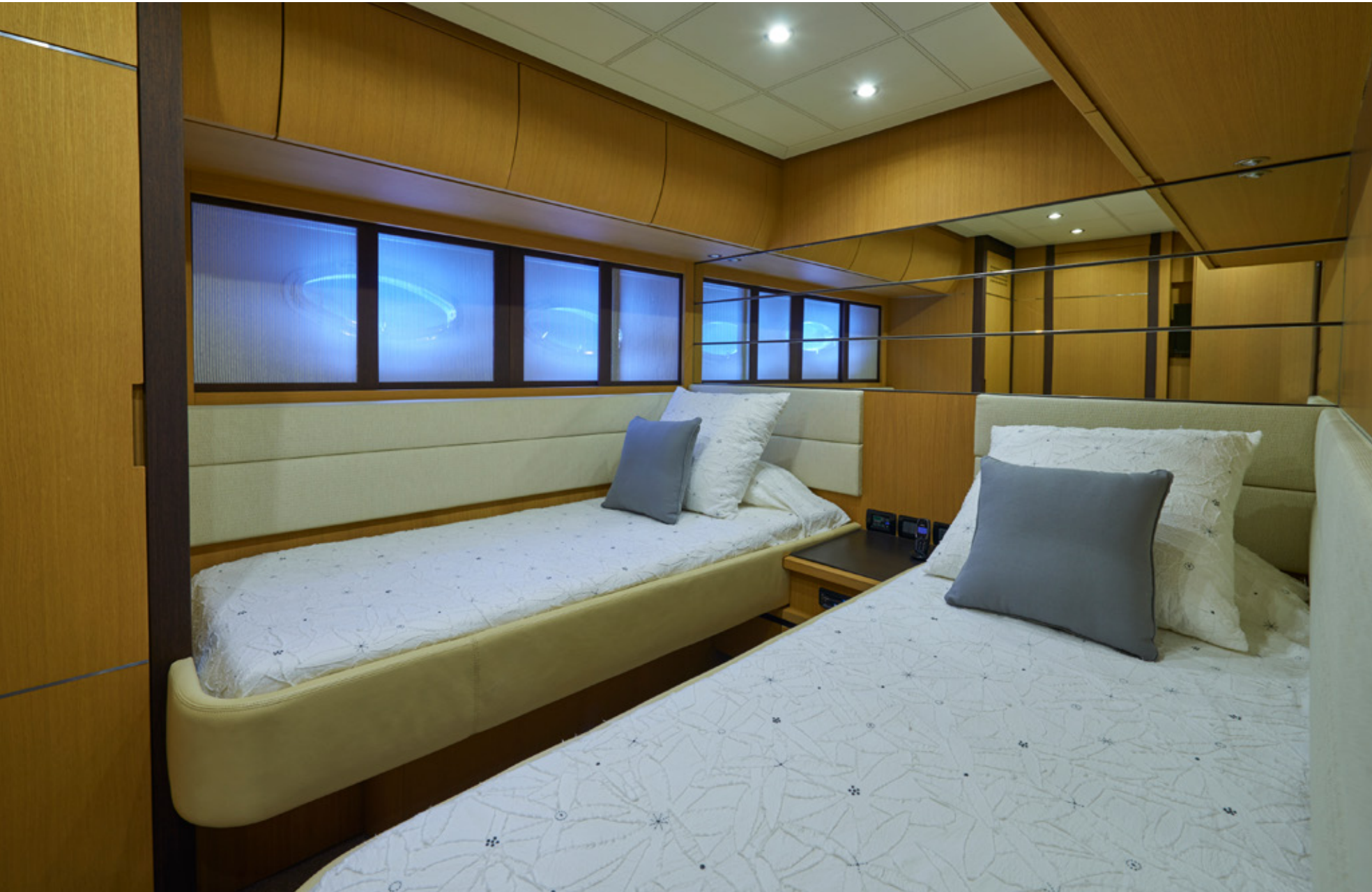
Camarote Twin estribor